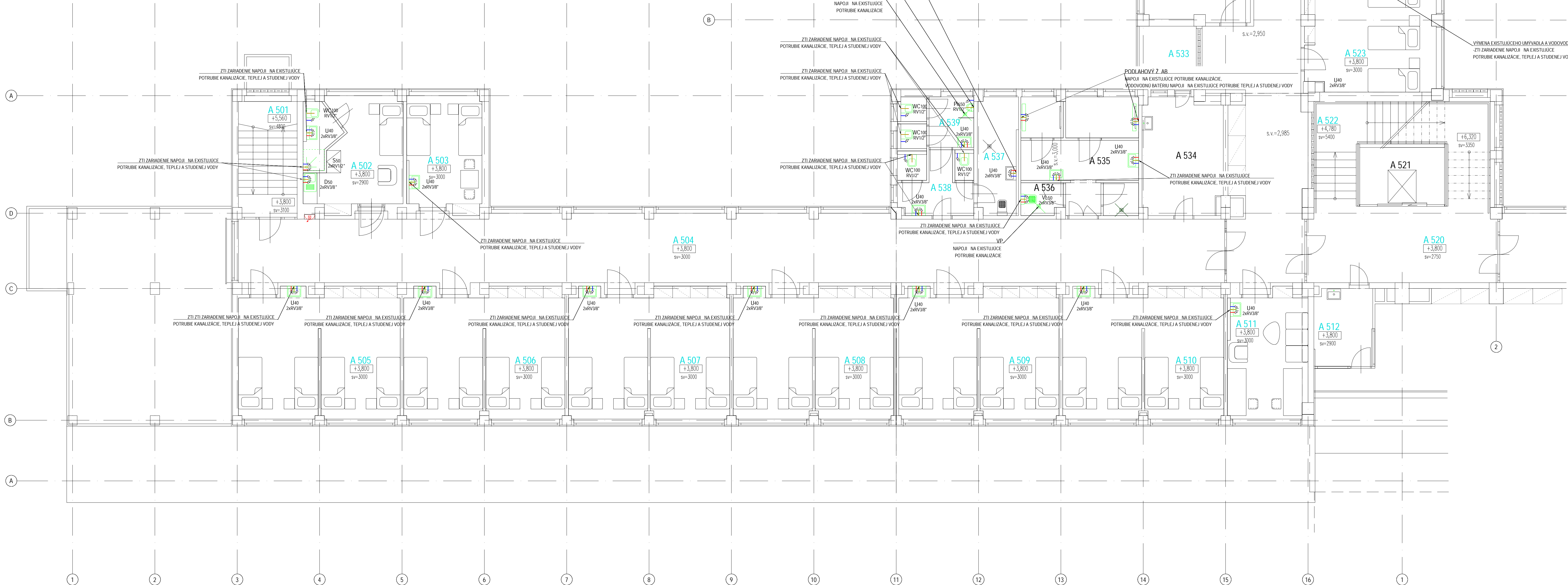
AS PAVILÓNU A: